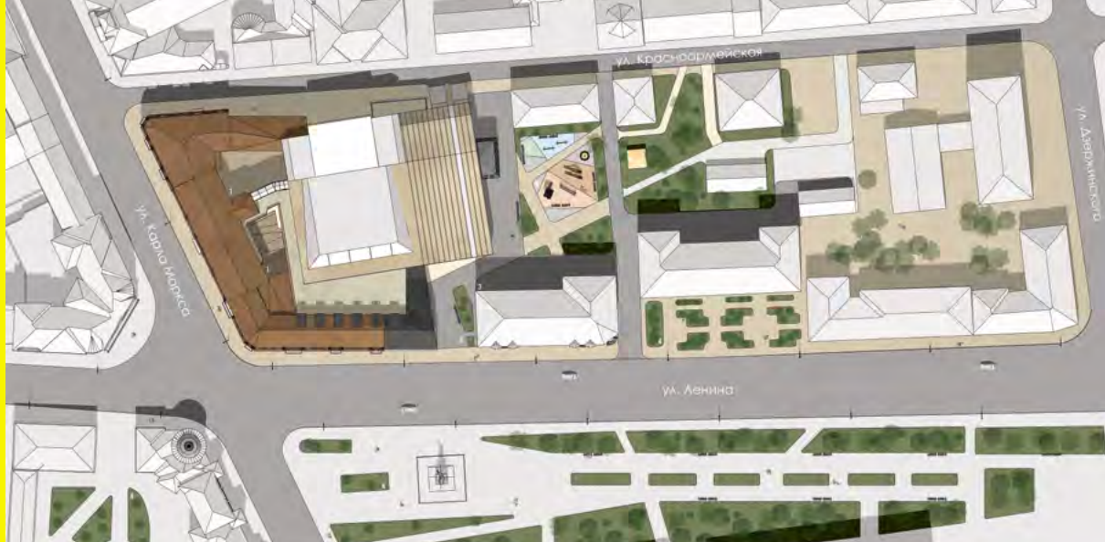
> План застройки территории