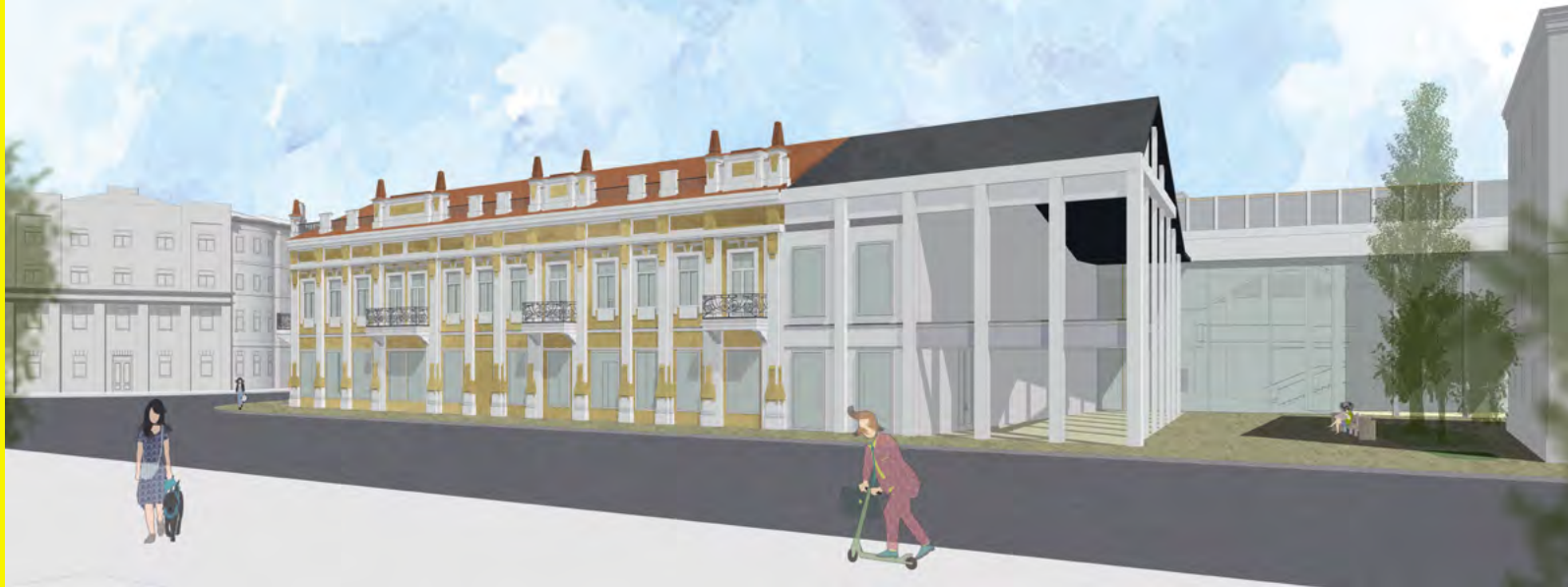
^ Вид с ул. Ленина