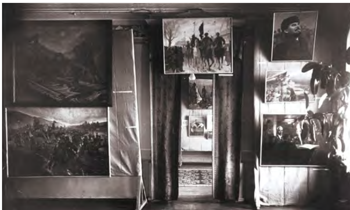
< Выставки иркутских художников, 1930-е гг.

дину: «Думаю, что Вы как-нибудь ускорите увеличение моей контрактации, укажите мне Ваши требования, обязывающие меня сделать то-то такого-то размера, может, даже и тему».