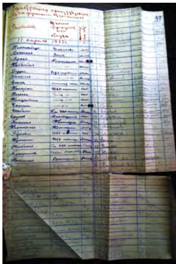
< Лист регистрации делегатов и участников Первой конференции художников Восточно-Сибирского края