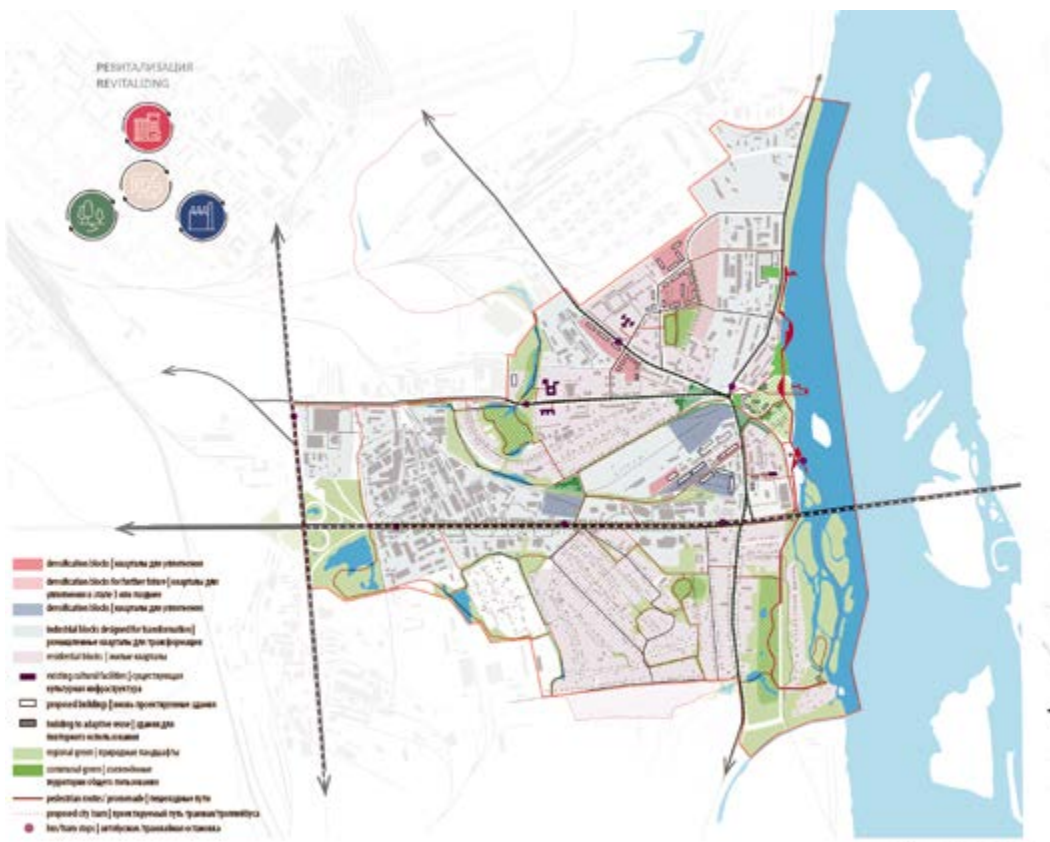
Схема генерального плана Overall masterplan

поддержку малого и среднего предпринимательства»; Министерство промышленности и торговли РФ а) «Модернизация объектов лесоперерабатывающей инфраструктуры, включая переработку древесных отходов, в том числе для целей биоэнергетики, с минимальными капитальными вложениями не менее 2 млрд. рублей»; в) Гранты регионам на создание индустриальных парков и технопарков; фонды развития промышленности - Программа льготного кредитования «Проекты Развития». Льготное кредитное софинансирование предусмотрено для проектов, направленных на импортозамещение и производство конкурентоспособной гражданской продукции.