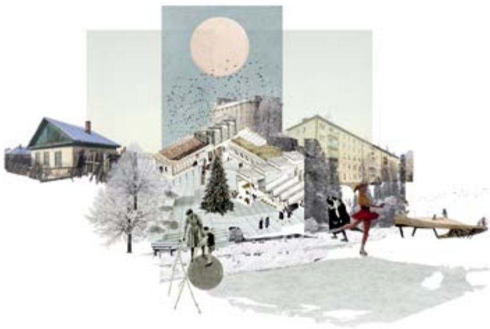
Главная площадь Main plaza