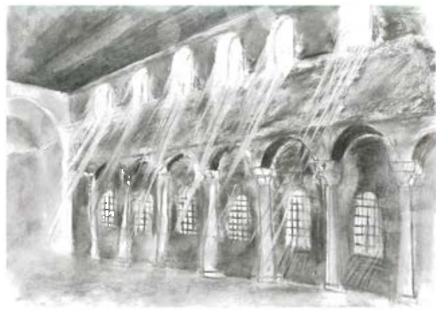
^ Упражнение на анализ световой среды исторических зданий (негатив распределения света в пространстве)

объединены российские властители и архитектурные явления: Иван III и формирование комплекса Кремля, Петр I и создание новой столицы, Екатерина II и развитие Царского Села, Александр I и петербургский ампи́р, в частности ансамбль Дворцовой площади, Николай I и храм Христа Спасителя.